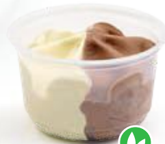
Vanille - Choc