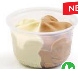
Vanille - Speculoos