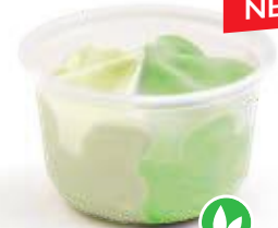
Vanille - Pistache