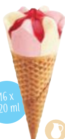
Vanille - Aardbei / Fraise