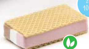
Trio Vanille - Choc - Aardbei / Fraise