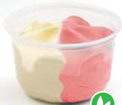
Vanille - Amarena