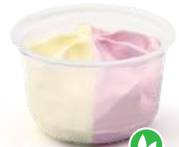
Vanille - Aardbei / Fraise