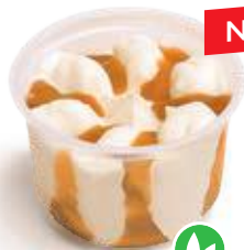
Vanille - Caramel