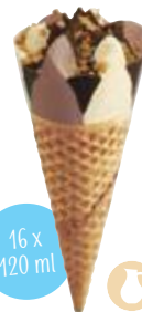
Vanille - Choc