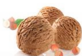
Hazelnoot / Praliné