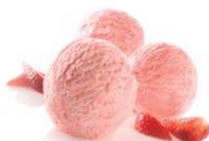
Aardbei / Fraise