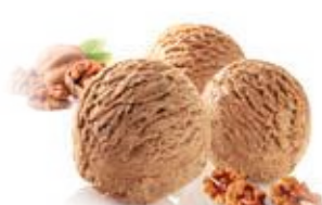
Walnoot / Noix