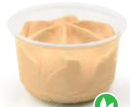
Walnoot / Noix