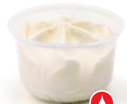
Citroen / Citron