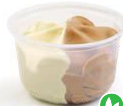
Vanille - Hazelnoot / Praliné