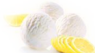
Citroen / Citron