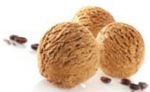
Mokka / Café